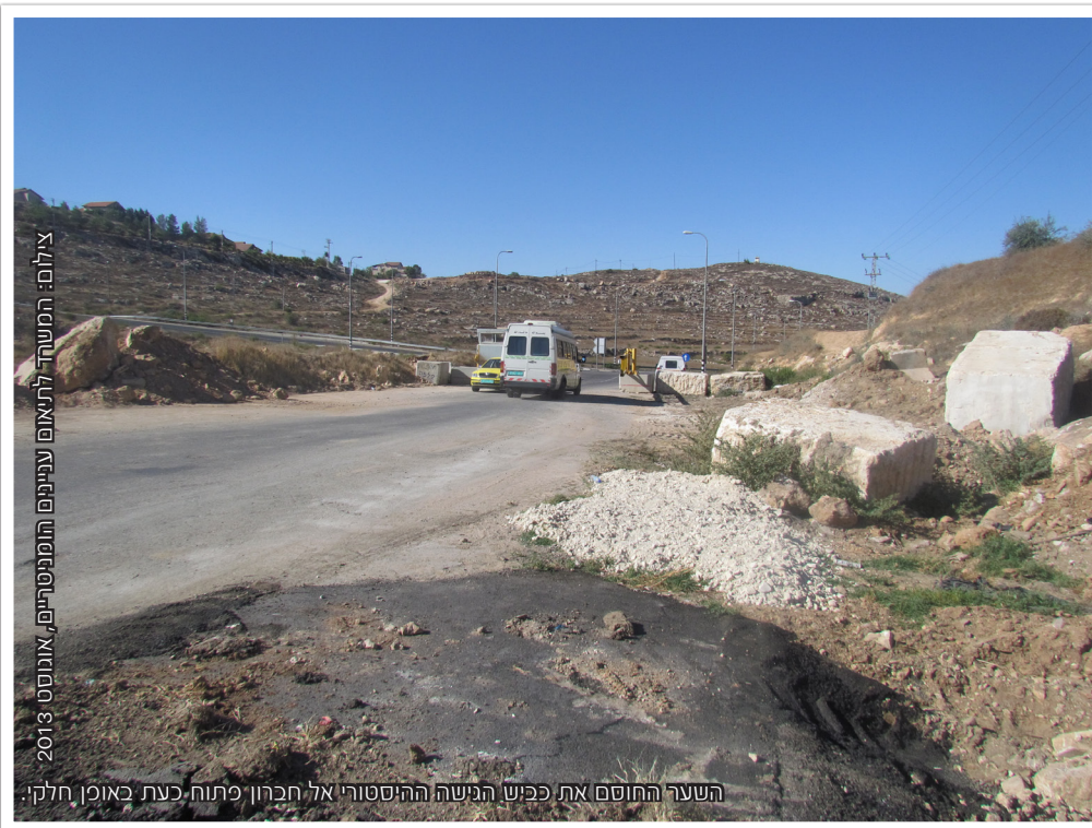
צילום: המשדח לתאום עניינים הומניטריים, אוגוסט 2013

המתפקדים הבודדים בכלכלה העזתית מוכת השפל. כמו כן, עקב סגירתו של מעבר רפיח, מספרם של מטופלי משרד הבריאות בעלי הפניות לטיפול בחו"ל שנסעו למצרים