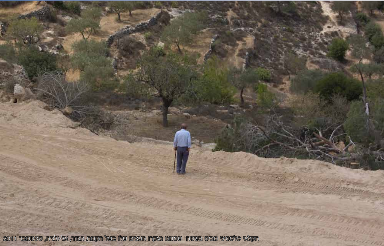
חקלאי פלסטיני מביט בשטח שממנו נעקרו העצים שלו בשל הקמת הגדר, אל-ולגיה, ספטמבר 2011