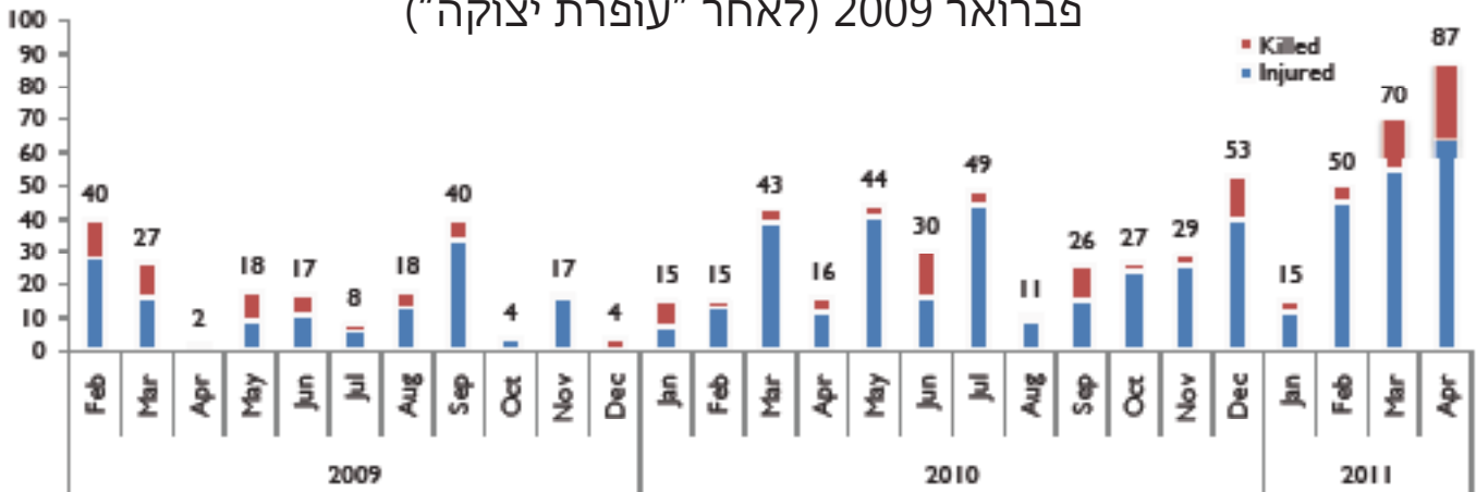
נפגעים פלסטינים כתוצאה ישירה מהסכסוך מאז פברואר 2009 (לאחר "עופרת יצוקה")

כמו כן החדש, ב-28 באפריל, ירו חמושים פלסטיניים פצצות מרגמה לעבר חיילים ישראליים שפטרלו