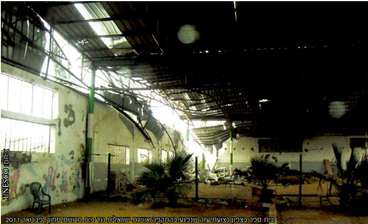
בית ספר בצפון רצועת עזה שנפגע בהתקפה אווירית ישראלית נגד בית חרושת סמוך, פברואר 2011.