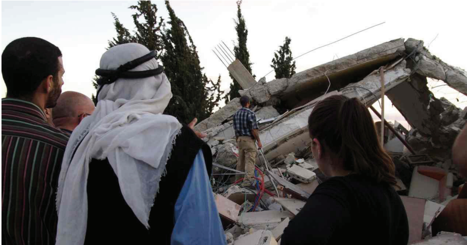
בניין בן ארבע קומות נהרס בבית חנינה ב-28 ביולי.

מ-76 ל-221 שבוע, בעיקר באזור חברון. תנועתם של רכבי או"ם, הנושאים מצרכי סיוע הומניטרי נותרה מוגבלת במחסומי הכניסה לירושלים. כ-80% מניסיונות UNRWA להעביר כלי רכב דרך מחסום המנהרות, מבלי שיערך בהם חיפוש, נכשלו וכלי הרכב נאלצו לנסוע בדרכים חליפיות ארוכות יותר, הכרוכות מטבע הדברים גם בעלויות גבוהות יותר.