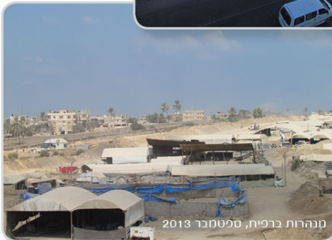
מנהרות ברפיח, ספטמבר 2013