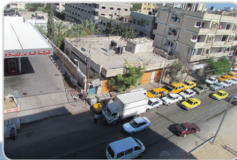
בני אדם מחכים בתור לדלק בעזה