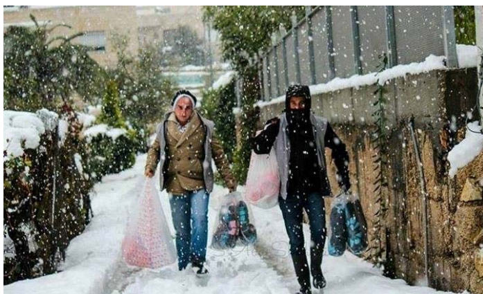
מתנדבים מחלקים מזון ופריטים שאינם מזון למשקי בית מוצפים, העיר חברון.