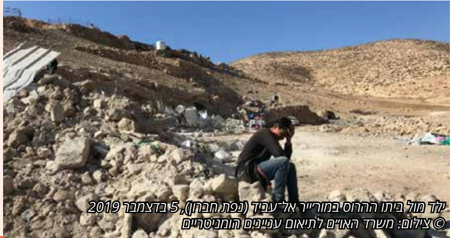
ילד מול ביתו ההרוס במורייר אל-עביד (נפת חברון), 5 בדצמבר 2019