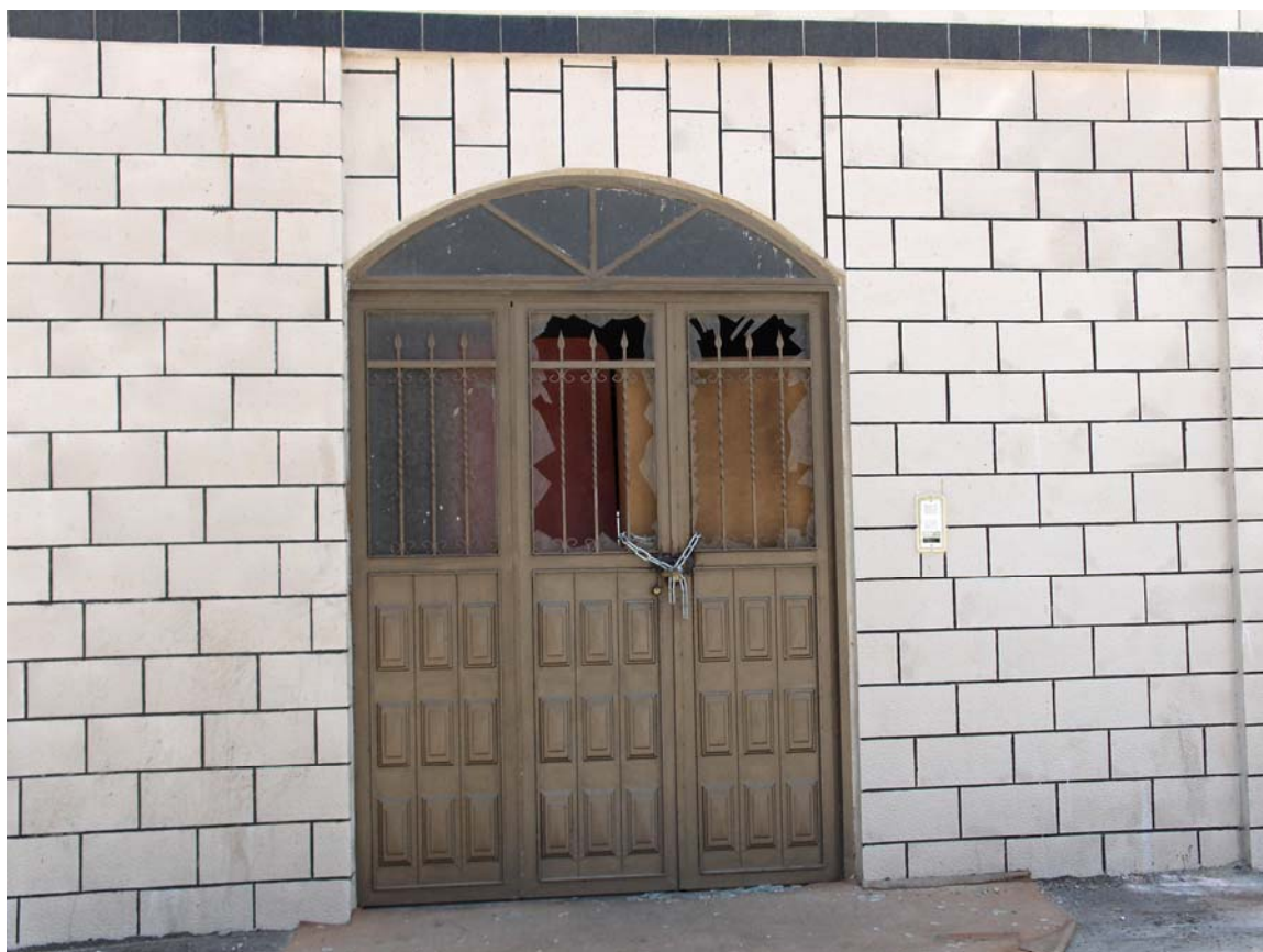
מרפאה של אגודת הצדקה אל אקסר (שכם), נסגר ב-2 ביולי 2006. צולם ע"י רוז ווילי, OCHA, יולי 2006