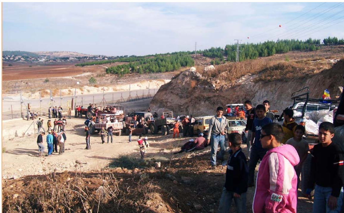
מוסקי זיתים פלסטינים ממתינים לפתיחת השער העונתי בח'רבת אל-דיר ב-2 בנובמבר 2006. צולם ע"י טארק תלחמה, OCHA נוב' 2006.

בחלק הצפוני של הגדר, מקום בו שוכנים 57 הכפרים שנבדקו, ישנם לפחות 61 שערים 4 כשבכל אישור נקבע מהו השער המסוים דרכו יכול החקלאי לעבור בדרך אל אדמתו. צה"ל משתמש ב-15 שערים לפחות לצרכים צבאיים בלבד. מתוך השערים שנותרו לשימושם של הפלסטינים, אחד עשר שערים בערך הוגדרו כ"עונתיים" ופרוש הדבר הוא כי הם פתוחים בעונת מסיק הזיתים בלבד, לעיתים לא יותר משלושה ימים.