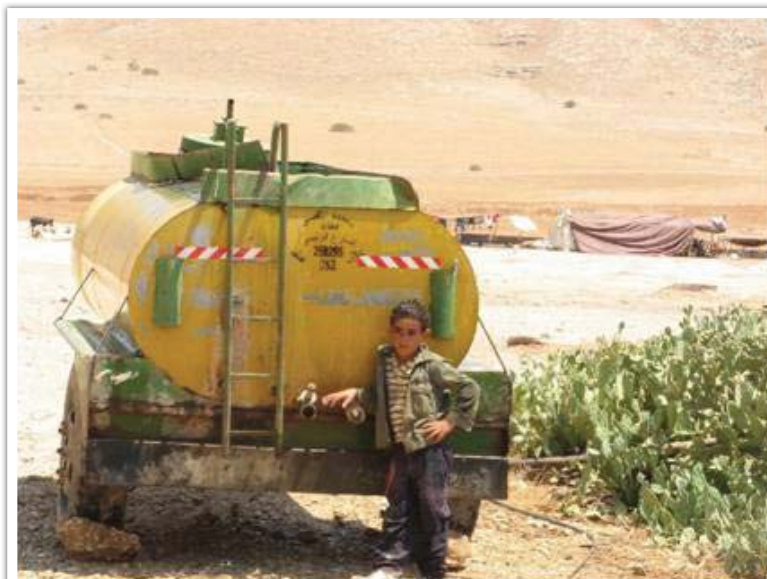
מיכלית המשמשת לאספקת מים מנקודת מילוי עבור משפחה בת עשר נפשות והצאן, בקעת הירדן, 2009.

אש סגורים. כ-18 אחוזים מן הגדה המערבית, 33 אחוזים משטח C, "סגורים" לצורך אימונים צבאיים, או לישטחי אש". אף שרשמית הגישה של פלסטינים לשתחים הללו אסורה, מידת אכיפתן של ההגבלות משתנה.