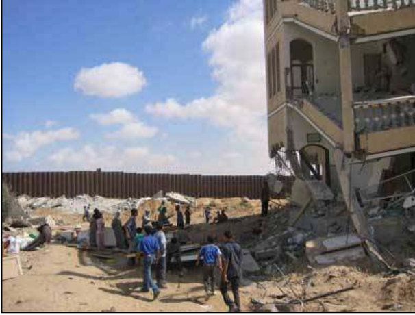
رفح، جنوبي غزة/ هدم بيوت قرب الحدود المصرية.