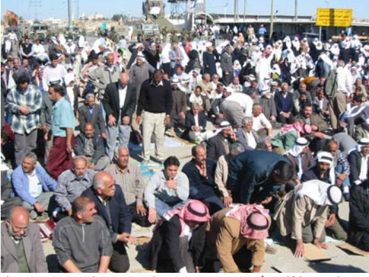
المصلون الفلسطينيون يؤدون الصلاة على حاجز جيلو